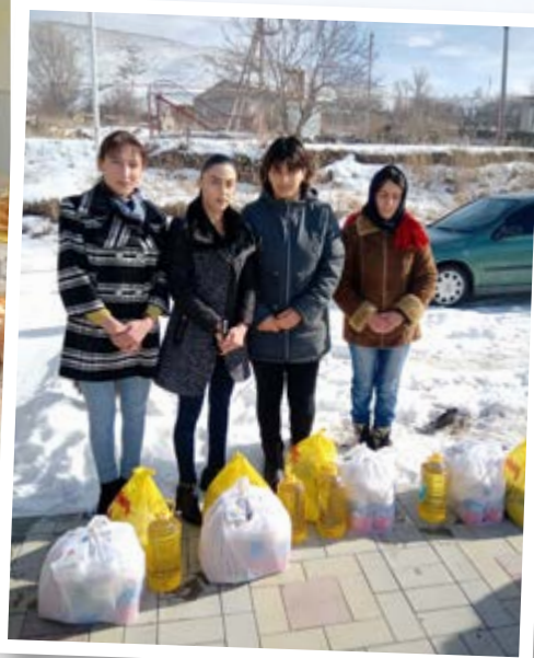
In de winter is het overleven voor de Armeniërs.