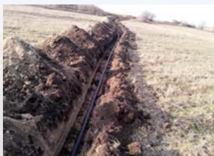
Waterproject in Lusaghpuyr.