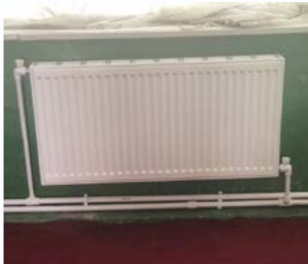
De radiatoren zijn vernieuwd.

Dit jaar is het geld besteed aan het vernieuwen van de verwarming in een kleuterschooltje in het dorp Vostan dat ruim 3.000 inwoners telt. Het schooltje bevat twee lokalen voor in totaal zestig kinderen. Omdat de verwarming niet goed werkte, kon het schooltje maar negen maanden per jaar open zijn.