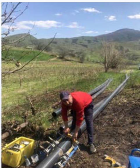
Het project in Achajur kon bijtijds worden afgerond. Het ging daar om negentig gezinnen en 46 hectare landbouwgrond.

In de vorige nieuwsbrief halverwege dit jaar schreven we dat er zeven verschillende waterprojecten gaande waren, her en der in dorpen in Armenië. Zowel voor drinkwater als voor het irrigeren van landbouwgronden.