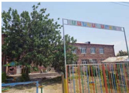
Het gaat om deze school in Vostan.

Al jaren krijgen we als SPHA van Kringloopwinkel De Wisselbeker in Nootdorp een prachtige bijdrage van 5.000 euro. In overleg wordt steeds een goede gerichte bestemming gekozen.