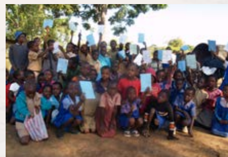
Met het geld wordt het onderwijs gestimuleerd.

Met de gelden voor Zimbabwe wordt ontwikkelingswerk ondersteund via de zogeheten Yellow Bus Trust die officieel is geregistreerd.