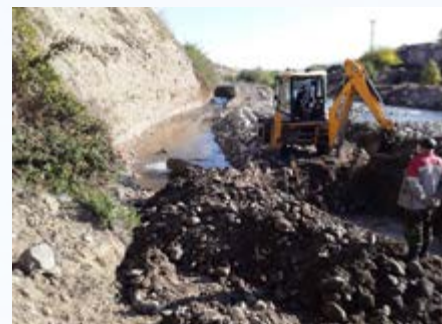
In Lusaghpuyr hebben 1.200 mensen voordeel van de verbeterde watervoorziening.