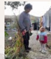
Dankzij Pijnackers breiwerk hebben Armeense kinderen het ook in de winter lekker warm.